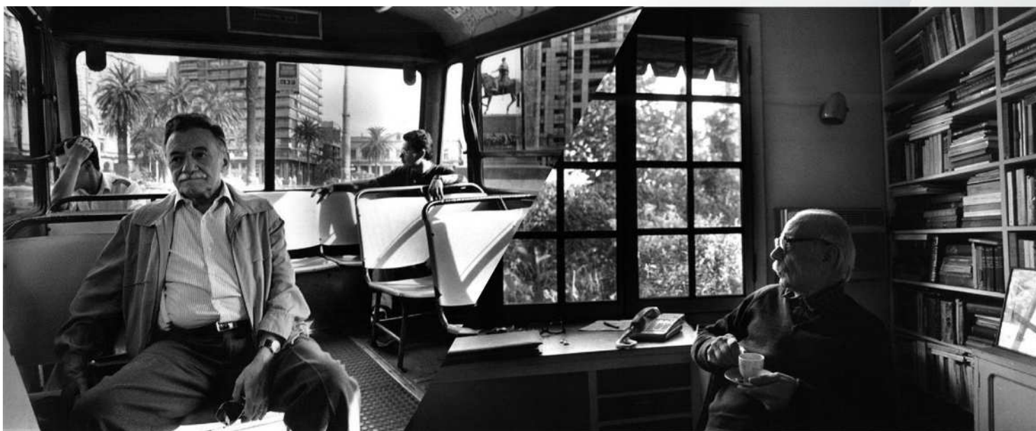
Sábato y Benedetti. Dos escritores, dos orillas