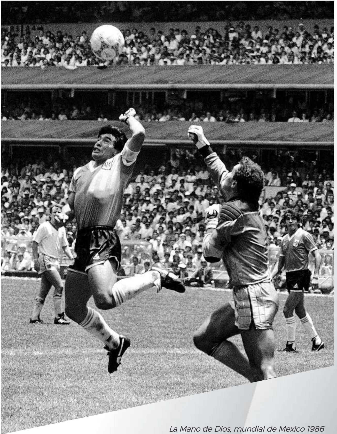
La Mano de Dios, mundial de Mexico 1986