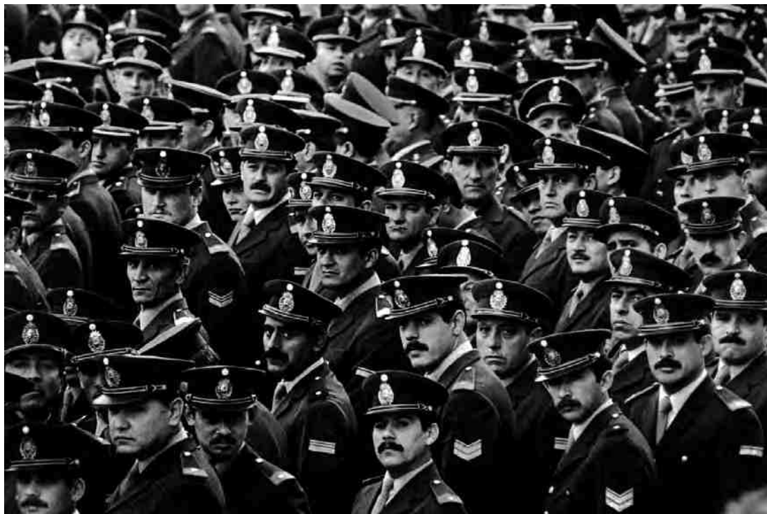
Vista al frente