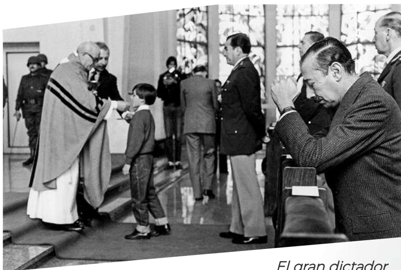
El gran dictador