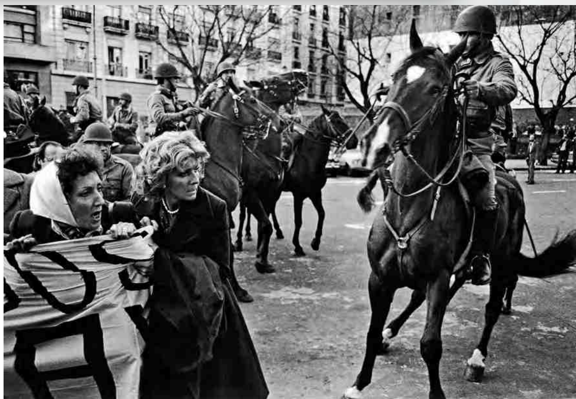
Represión a las Madres de Plaza de Mayo