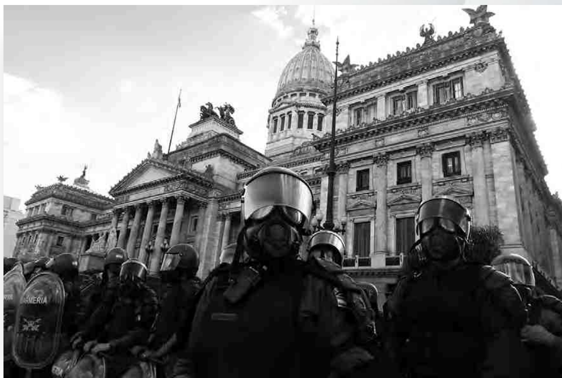
Protestas por la reforma jubilatoria (2017)