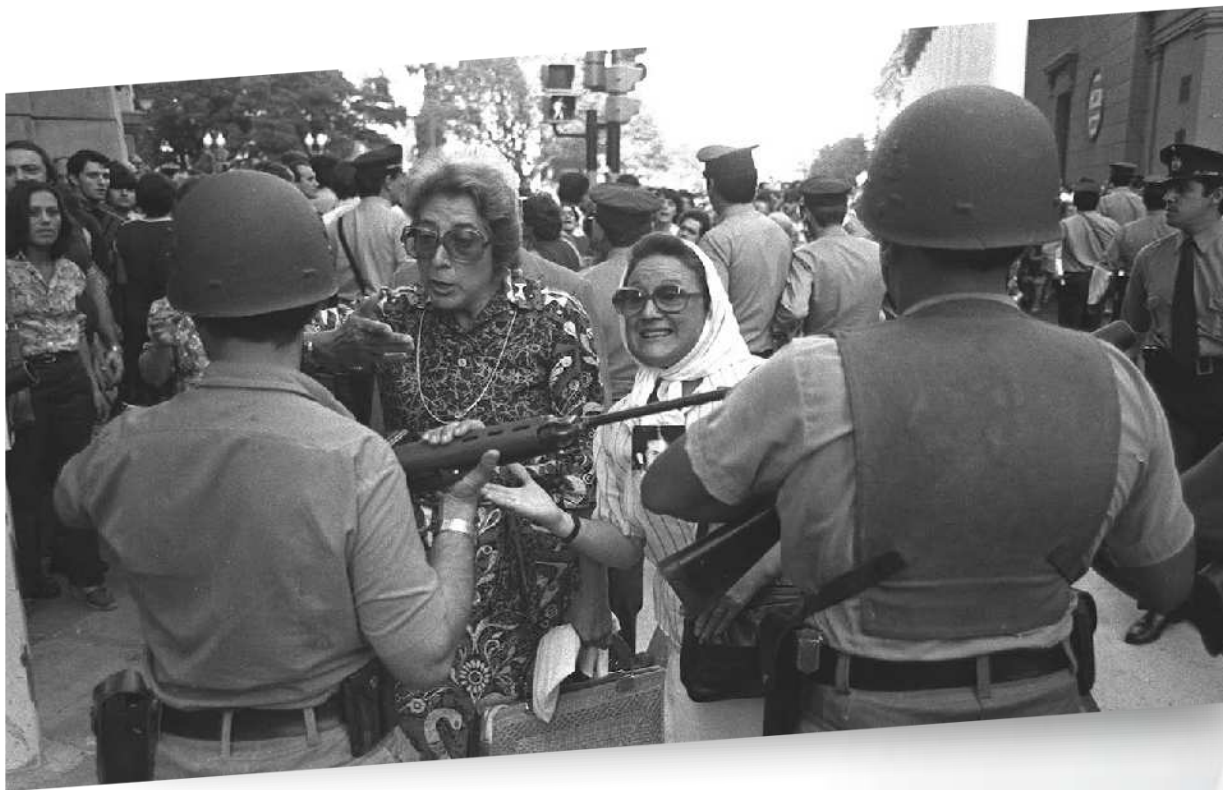
Madres de la Plaza de Mayo