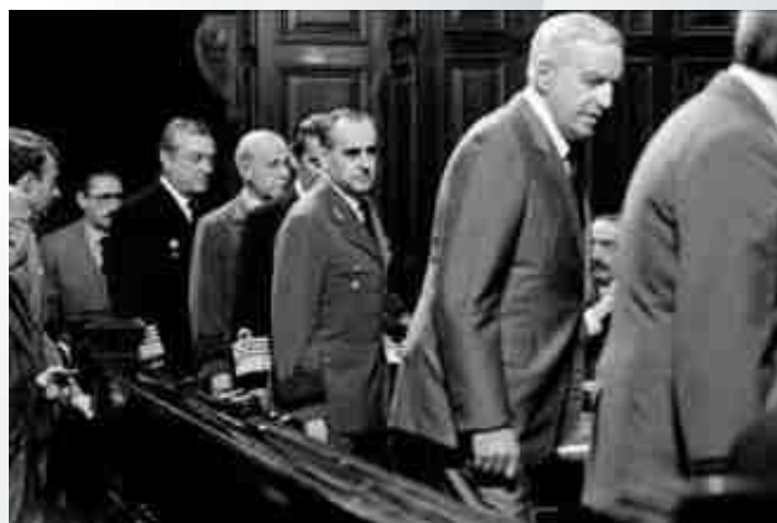
Juicio a las Juntas