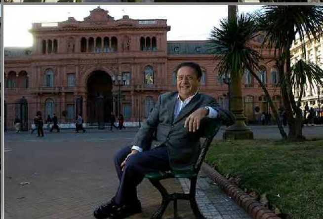
Presidentes de la democracia